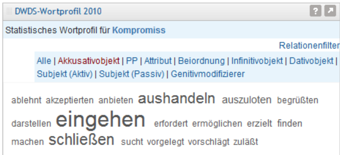
Abb. 2: Statistisches Wortprofil für Kompromiss , http://www.dwds.de/search/?qu=Kompromiss&view=1 [12.10.2011]

Abbildung 2 gibt einen Überblick über Verben, die oft mit Kompromiss verwendet werden – je größer sie gedruckt sind, umso häufiger ist die Kookkurrenz im DWDS-Kernkorpus. Ziemlich fehl am Platz wären Verben wie ankommen und kommen , zu denen etwa italienische Lerner aufgrund der Gegebenheiten in ihrer Muttersprache neigen. Sie sollten möglichst früh lernen, dass man das nicht einfach wörtlich übersetzen kann. Das ist wichtig für die Fähigkeit, korrekte und angemessene Äußerungen zu produzieren.