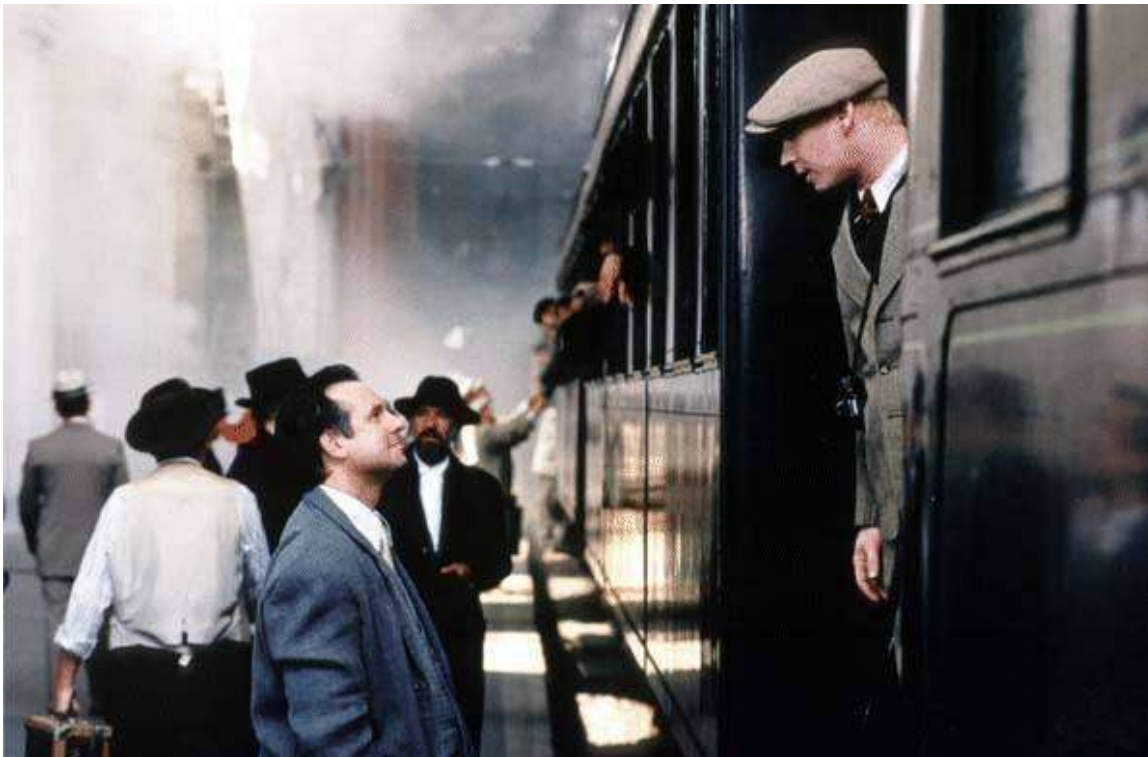
Standbild: Kapitel 4, Pause: 0:25:03 Std.

In der zweiten Bahnhofsszene (Kapitel 13 ▶ 1:37–1:38 Std.) sehen wir ebenfalls die beiden Protagonisten. Als einer der mächtigsten Männer in Budapest befindet sich Hans nun in einer Position, die es ihm ermöglicht, László vor dem sicheren Tod im Konzentrationslager zu bewahren.